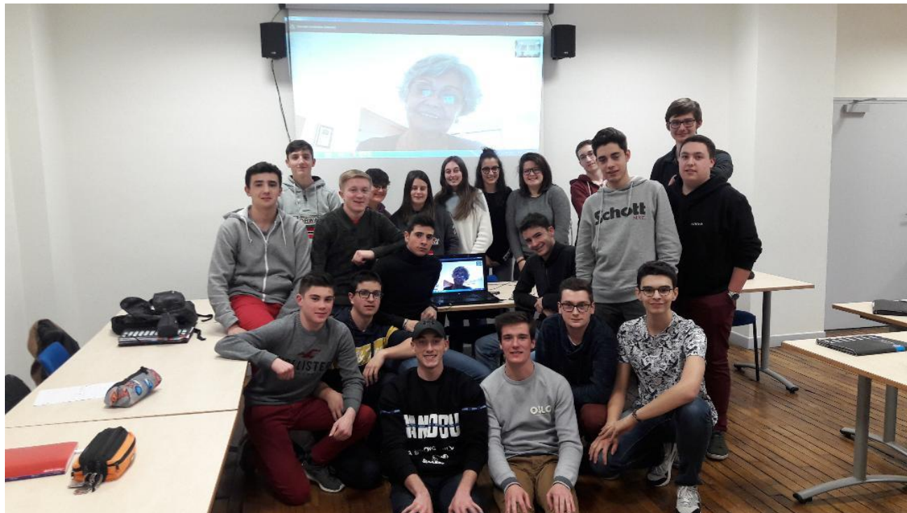
Photo souvenir, vidéo-conférence du 14 mars 2019.