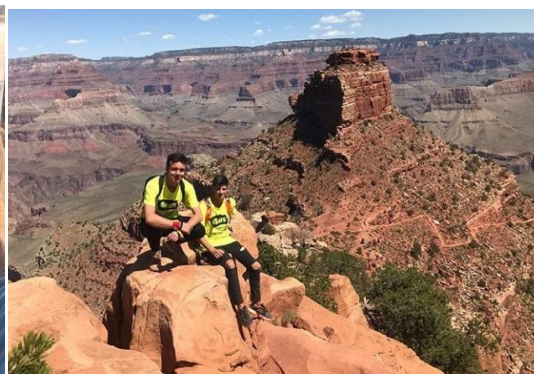
Un élève de 1 ère S du lycée CARAMINOT dans le COLORADO avril 2019