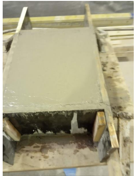
Une fois le béton mis