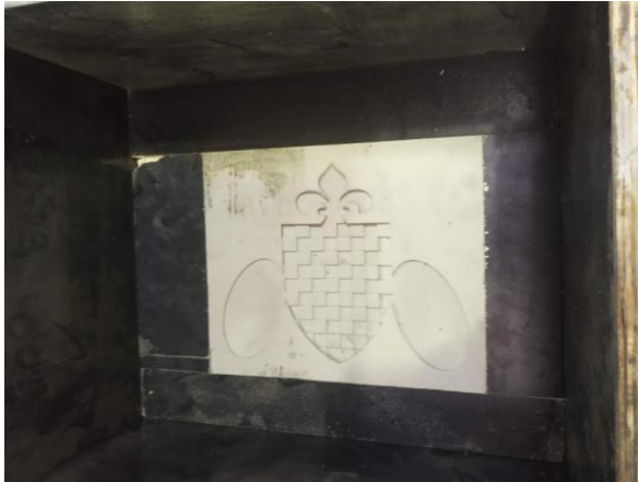
Le moule dans le coffrage