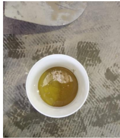
Mélange entre le composant et le durcisseur :